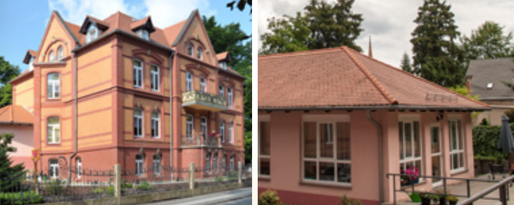
Villa am Park Bad Muskau